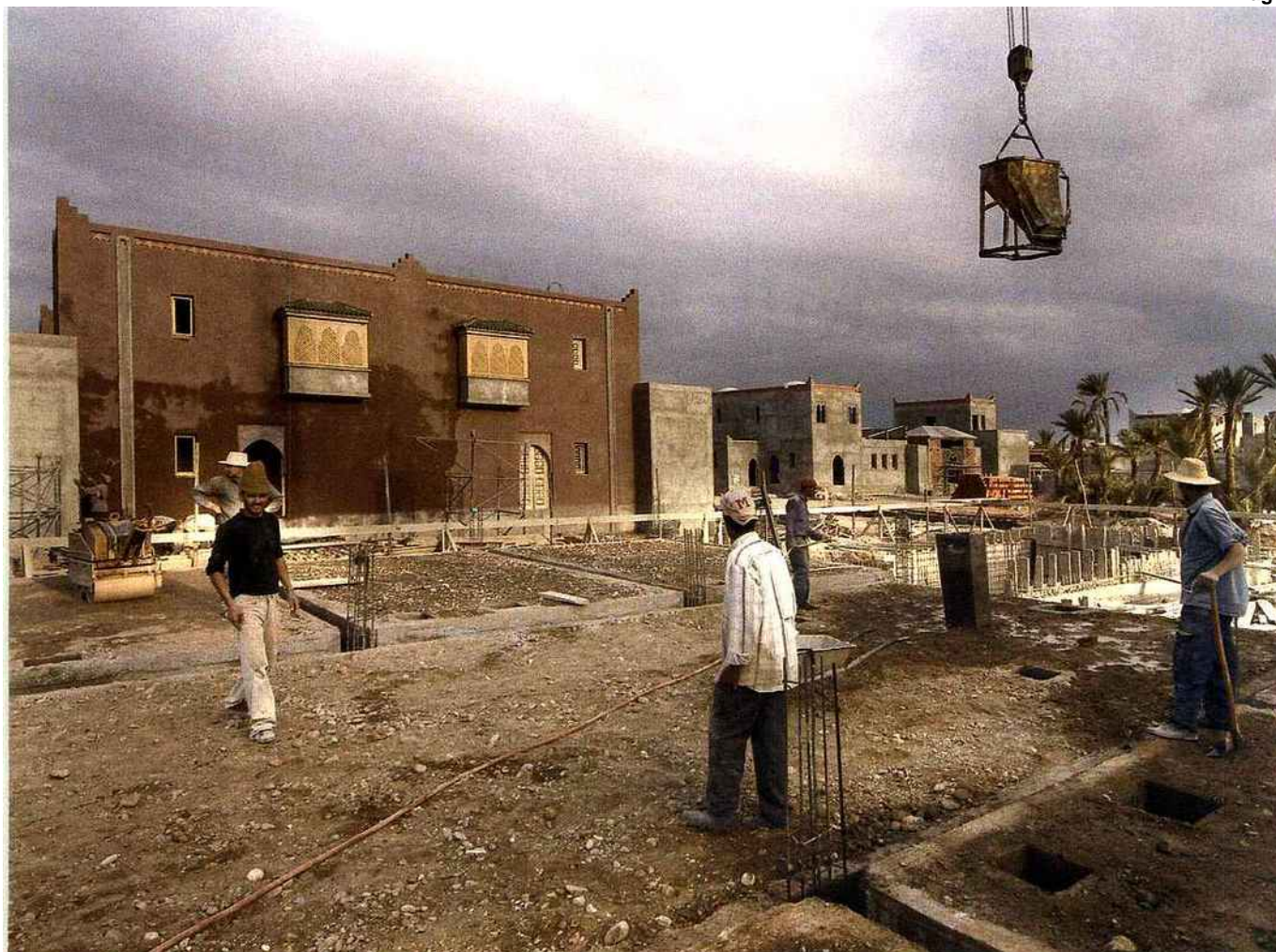
Résidence Dar Lamia, à Marrakech. Amplifié par la croissance démographique, le boom immobilier touche toutes les grandes villes du pays.

Méditerranée, le gigantesque port de Tanger Med a ouvert partiellement ses portes ( lire notre reportage page 70 ). A proximité, la zone franche s'étale à grande vitesse : Renault-Nissan a prévu d'y installer une usine d'où devraient sortir 200 000 véhicules dès 2010. Autre priorité stratégique : l'offshoring. Plus de 22 000 emplois ont déjà été